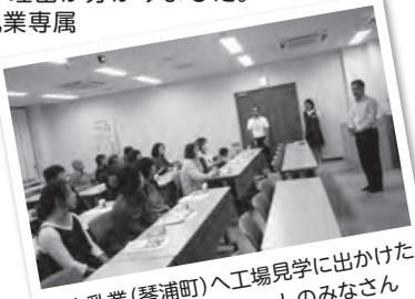
大山乳業(琴浦町)へ工場見学に出かけたふれんどり〜地域ネットのみなさん

鳥取県の全ての酪農家から集められた牛乳が大山乳業で処理されて出荷されているそうです。鳥根県は複数の乳業があるので、大山乳業が大規模な理由が分かりました。また、大山乳業専属の獣医師がいたり、牛乳の検査も厳しくされていて驚きました。