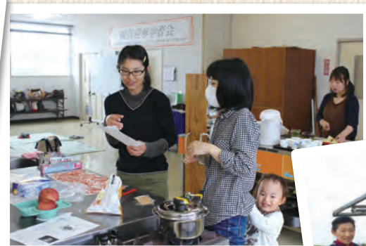
益田「子育て・くらぶ」の活動のようす