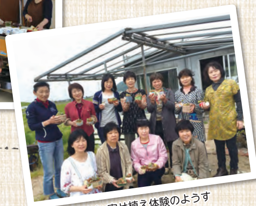
木次地域ネット 寄せ植え体験のようす