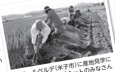
リサールベルデ(米子市)に産地見学に出かけた西津田地域ネットのみなさん

泥付き白ネギの収穫をさせていただきました。広大な敷地で元気よく育った白ネギ。葉もピーンと太く長く、見ただけでもおいしそうでした。泥付き&根付きなので、庭の土をかぶせるとしばらく保存できることを聞きました。おいしいネギ料理もみなさんから聞けたので作ってみようと思いました。