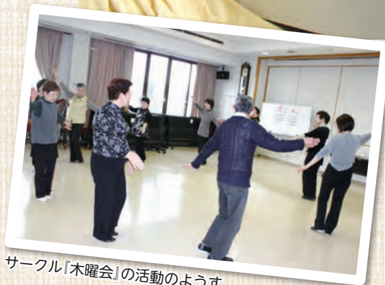
サークル「木曜会」の活動のようす