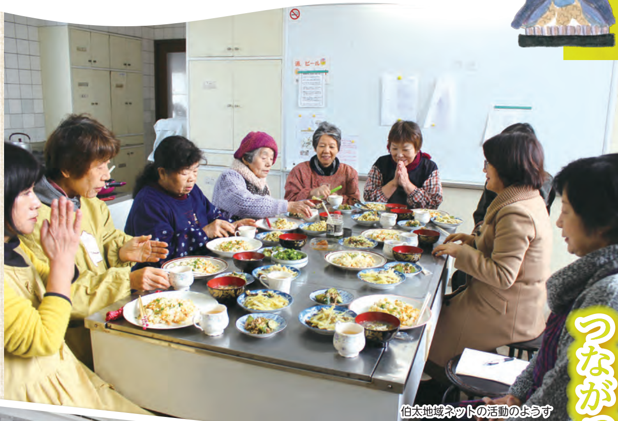
伯太地域ネットの活動のようす