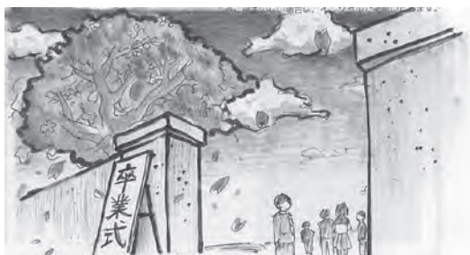
出雲市 たいちゃんズさん