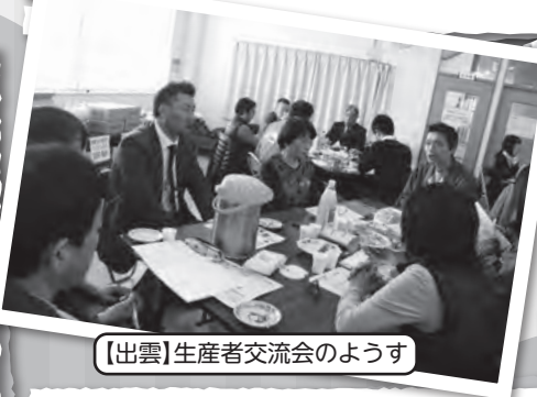
【出雲】生産者交流会のようす

今回は生産者カードから、たくさんの『おいしかった』の声をいただくことができました。読ませていただくと感じますし前向きな気持ちになりますが、もう少し厳しい声があって当たり前だと思います。厳しい声も素直に受け止めて組合員、生協と一緒に“葉とらずりんご”を作ることができたらと思います。