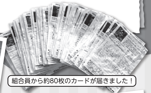
組合員から約80枚のカードが届きました！