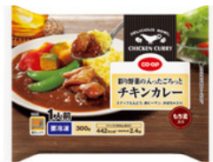
彩り野菜の入った ごろっとチキンカレー