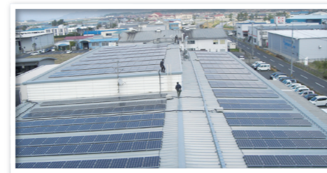
屋根の上と駐車場に設置された太陽光発電パネル