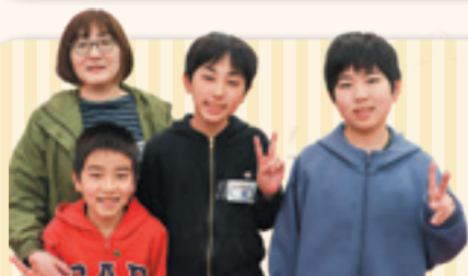
参加された堤さんご家族