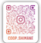
生協しまね Instagramは こちらから