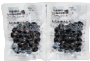
しじみ屋さんの冷凍しじみ

宍道湖のしじみ漁は、週4日(月・火・木・金)操業で、1日の操業時間や漁獲量はしっかり管理されるなど、資源保護にも配慮しています。品質管理を徹底している50名の漁師を指定し、特許取得の「低温オゾン殺菌砂抜き処理」で旨みを引き出しながら凍結されています。また、ヨシ帯の保全活動など、宍道湖の環境を守る取り組みも行われています。こうした取り組みや工夫について学習しました。