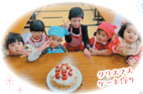
クリスマス ケーキ作り