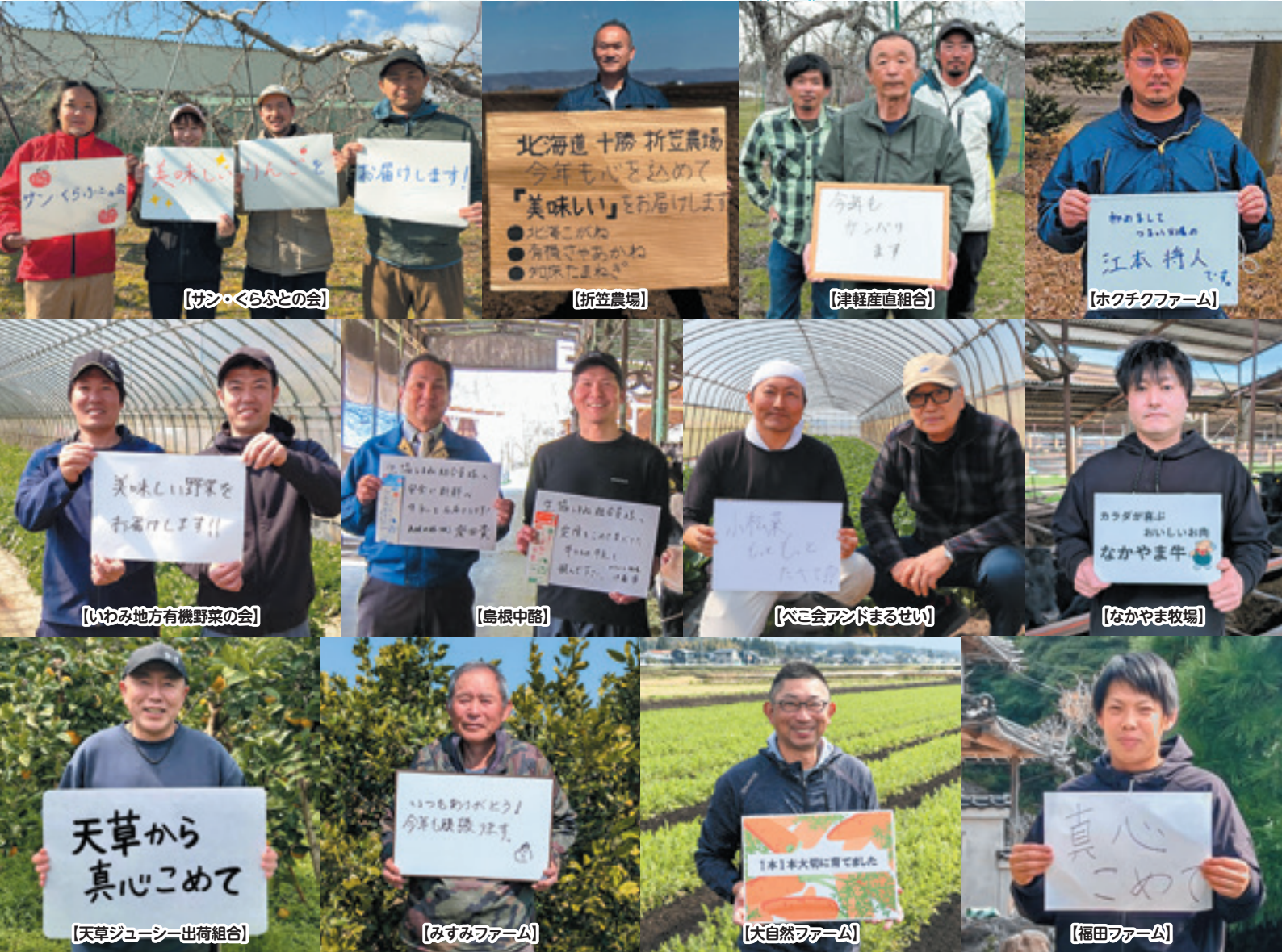
表紙：産直提携先の生産者のみなさん