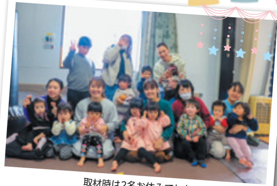
取材時は2名お休みでした

くらぶでは、アクアスへお出かけしたり、こっころ講師を招いて歯磨き粉作りをしたり、クリスマス会をしたりいろいろな楽しい活動をされました。昨年のクリスマス会では、お子さんたちがクリスマスケーキ作りに挑戦し、生協のクリスマスケーキコンテストにも参加されたそうです。