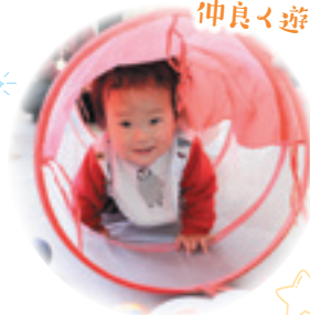
お子さんどうしも 仲良く遊んでいました♪